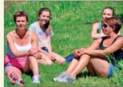
Godt med en pust i bakken.