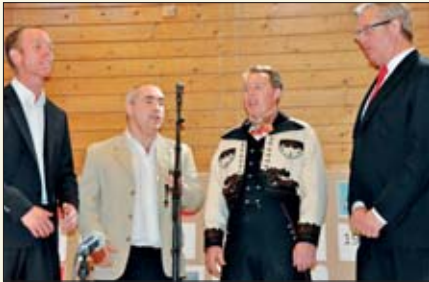
Ingen ting er som frisk mannsang!