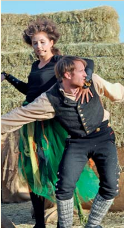
Kittil blir forført av de underjordiske og tatt med inn i fjellet.