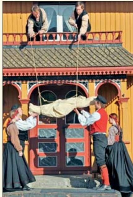
En død person tas ut gjennom vinduet og fires ned for at personens gjenferd ikke skal finne veien inn i huset igjen.