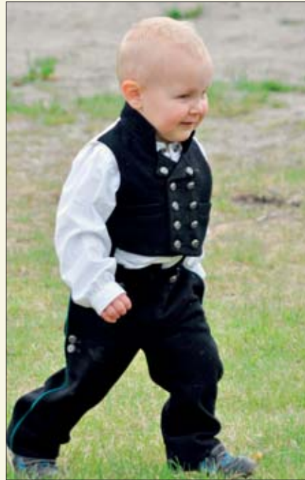
Her gjelder det å feire i fulle drag.