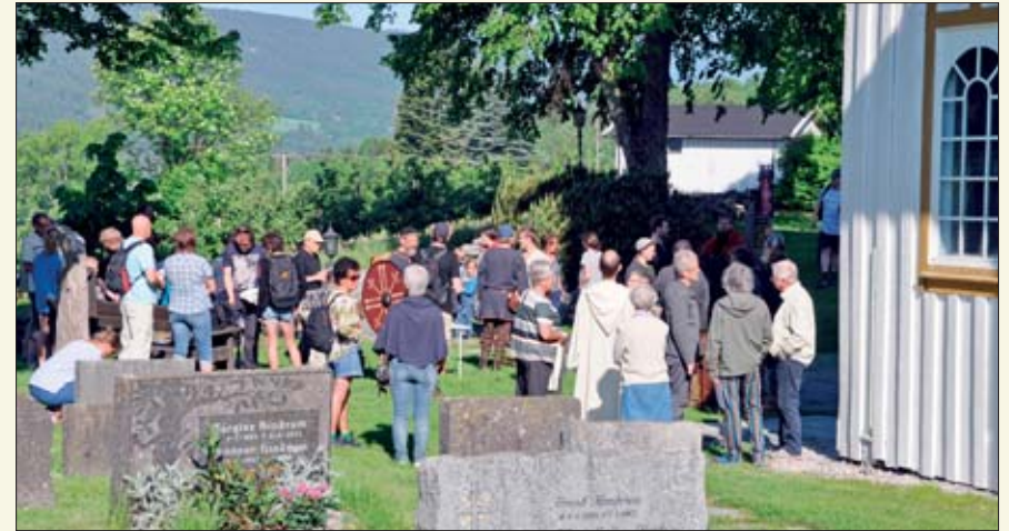
Folket samlet seg utenfor Nes kyrkje.