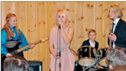
Unge musikere framførte sin egen låt Cod war.