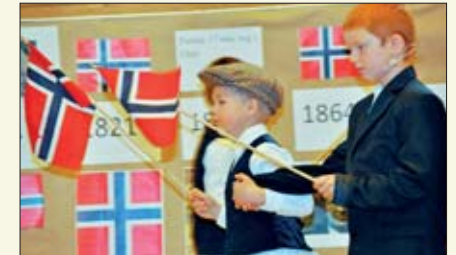
På 1850 tallet gikk det første 17. maitoget. Men det var bare voksne menn som fikk være med i toget.

Alle førsteklassingene imponerte stort. Vi fikk høre om grunnloven, Eidsvollsforsamlingen, flagget, nasjonalsanger, 17. maifeiringen og mange andre ting fra Norges historie. Og flere ganger leste de unge