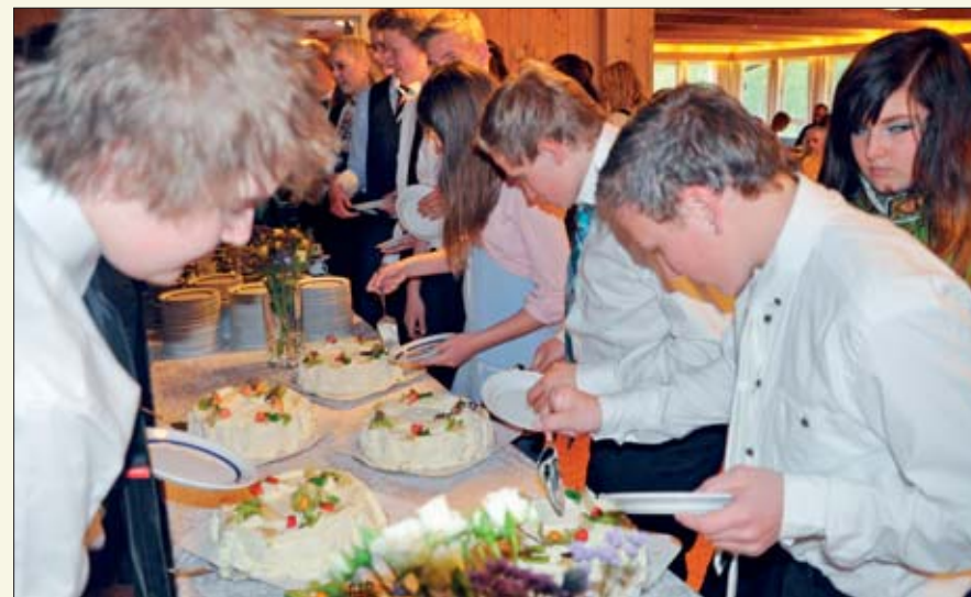
Servertingen på konfirmantfestene er også tradisjonell. Etter at lapskausen er fortært så kommer bløtkaka på bordet.