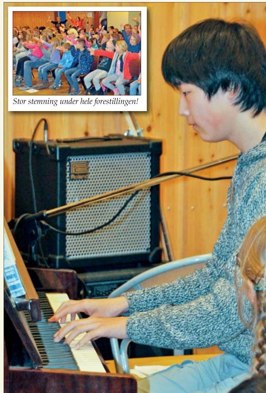
Stor stemning under hele forestillingen!