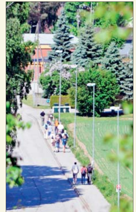
Fra Tinghaug hadde man godt utsyn over de mange vandrerne.