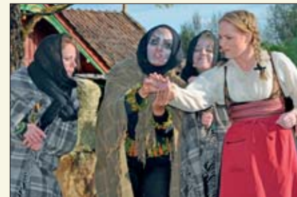
De underjordiske spår Karis framtid.