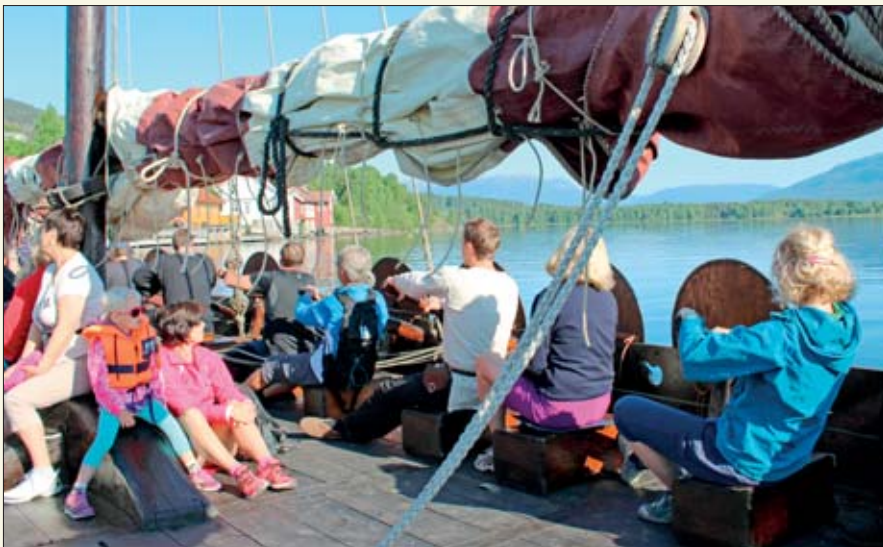
Det er om å gjøre å holde takta!