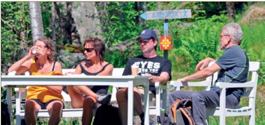
Været var nydelig og folkene glade!