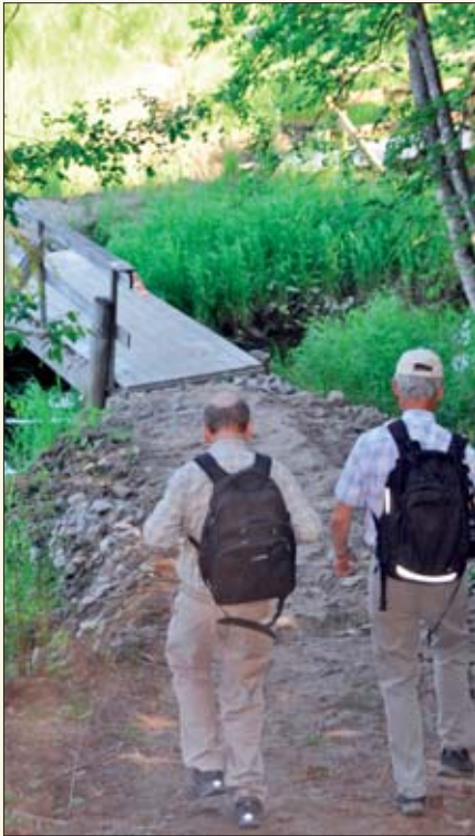
Bruene langs Gvarv-elva var restaurert og bygd opp, så nå kunne alle komme tørrskodd fram.