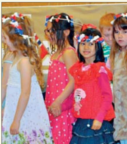
Men etter hvert fikk også jentene være med.