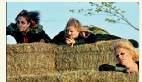
Huldrene passe godt på den bergtatte sønnen fra Klevar.