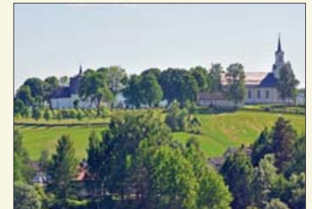
Endelig, målet er i sikte.