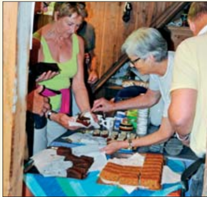
På Hørte dampfargeri var det mulighet for påfyll!