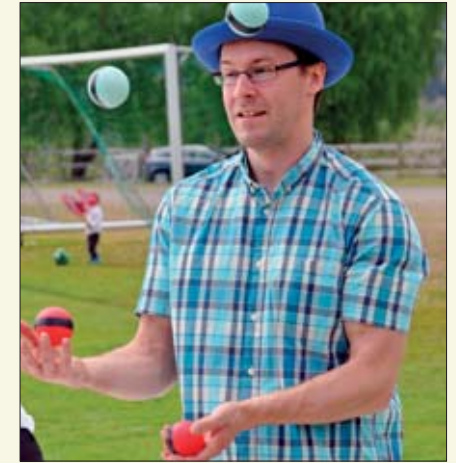
Sjonglering er for de viderekommende.