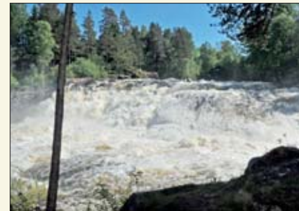
Fossefallene var et mektig syn.