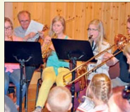
Til åpning av konserten framførte en blåsegruppe Flaggsang.