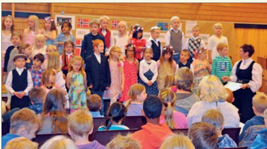
Mange av våre kjente nasjonalsanger ble framført i løpet av forestillingen.