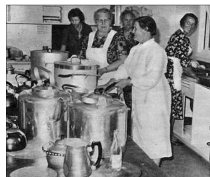
Mye mat skulle lages til den storforsamlingen.

Så tidene skifter med dager og år. Leirstedet har vært et godt redskap for å nå barn og unge med evangeliet, og et godt sted å være sosialt og kulturelt. Norsjø drives fortsatt etter sitt formål: "Verden for Kristus".