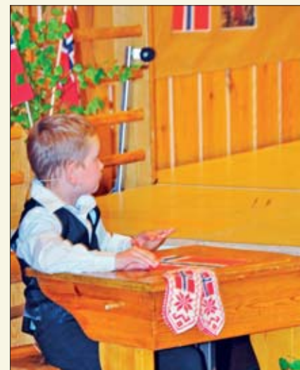
Her er det om å gjøre å være med på skape det nye flagget til Norge.