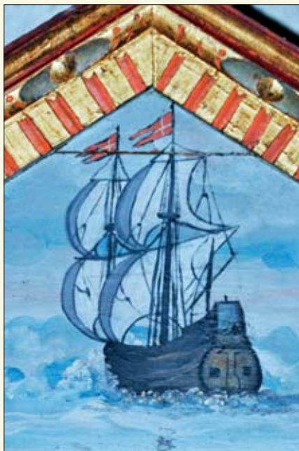
Kirkeskipet på altertavla i Nes kyrkje.

Når vi snakker om den store vandringen, den lange reisen, den fra vugge til grav, - livet - sier vi ofte at kirkeskipet er en god farkost på den reisen. Det er vel nettopp derfor at rommet der menigheten sitter