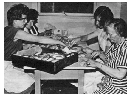
I følge bildeteksten i Utsyn måtte også ungdommen trå til for å skape fest.

Norsjø ungdomssenter er i de senere år blitt renovert. Særlig internatene har fått forhøyet og mer tidsriktig standard. Hovedbygget ser nå litt slitent ut, men er fortsatt funksjonelt og godt vedlikeholdt.