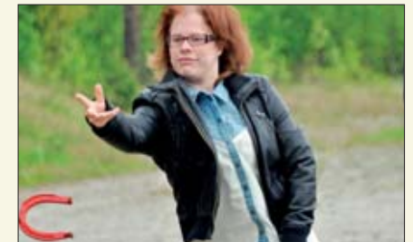
På Akkerhaugen er alle de tradisjonelle 17. maiaktivitetene representert: heste- skokasting,