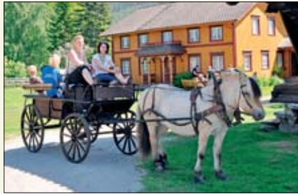
Heldige og sårføtte pilegrimer kunne få hesteskyss en del av veien.