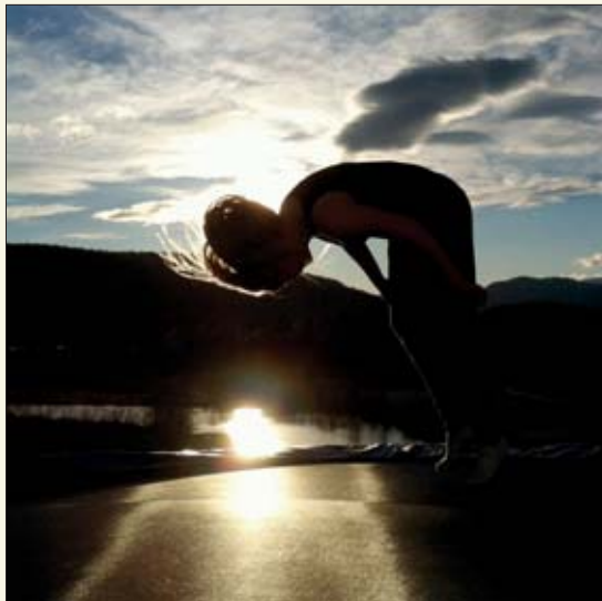
Dette er vinnerbildet i Sauherad skoles fotokonkurranse med tema Frihet. Bildet er tatt av Ida Liv Vaaer som går i 8. klasse.