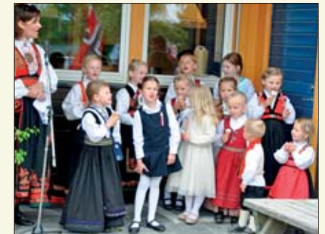
På Akkerhaugen startet feiringa med nasjonalsangen.