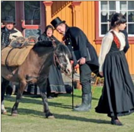
Futen er på besøk på Klevar for å se om de har noe sølv som bør beskattes.