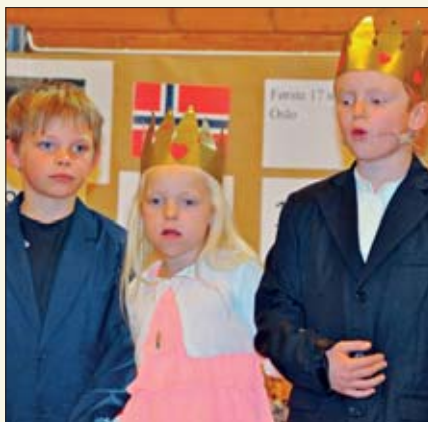
Norge fikk eget kongepar i 1905.