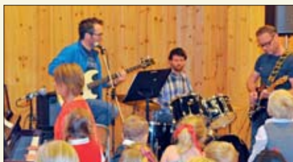
Et band bestående av lærer akkompagnerte fellessangen.