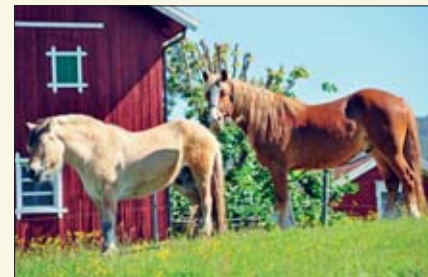
De hadde mye flott å se på denne dagen!