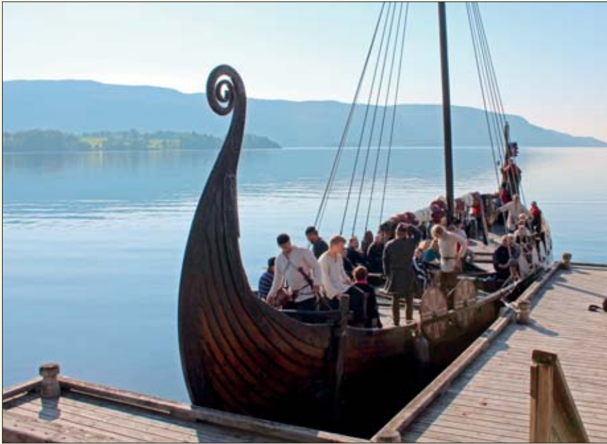
De som hadde lyst kunne være med å ro vikingskipet Åsa over Norsjø fra Årnes brygge til Nes brygge.