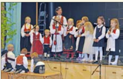
En flott dag trenger en verdig avslutning