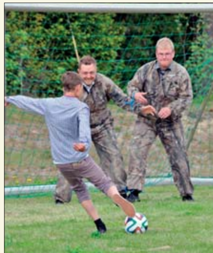
Førti unger mot ti menn sammenbundet to og to ble røtt parti.